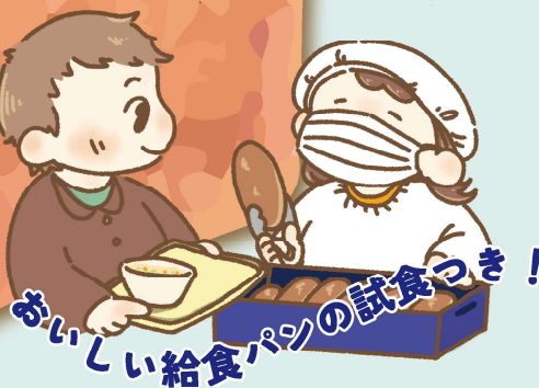
おいしい給食パンの試食つき!